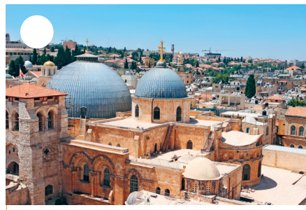
Basilique du _____

Les deux plus grands édifices de cette vaste place – tous deux érigés à partir du VII e siècle – sont liés, selon la tradition musulmane, au « voyage nocturne » de Mohamed et à son ascension céleste. Comment s'appellent-ils ?